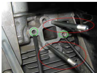
Fig. 5. Se demontează șuruburile suport pentru carburator (încercuite cu roșu). Se filetează găurile încercuite cu verde.