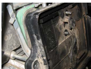
Fig. 1. Se demontează ansamblul filtru aer.

În cazul în care se observă funcționarea defectuoasă a acestor carburatoare, în mod repetat (chiar dacă sunt curățate periodic), vă recomandăm înlocuirea carburatoarelor cu membrane cu carburatoare cu plutitor. Vă prezentăm în continuare pașii de urmat.