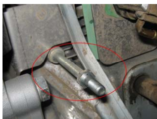
Fig. 4. Se demontează șurubul suport pentru ansamblul filtru aer (încercuit cu roșu).