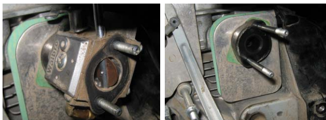
Fig. 2-3. Se demontează carburatorul, izolatorul, garniturile.